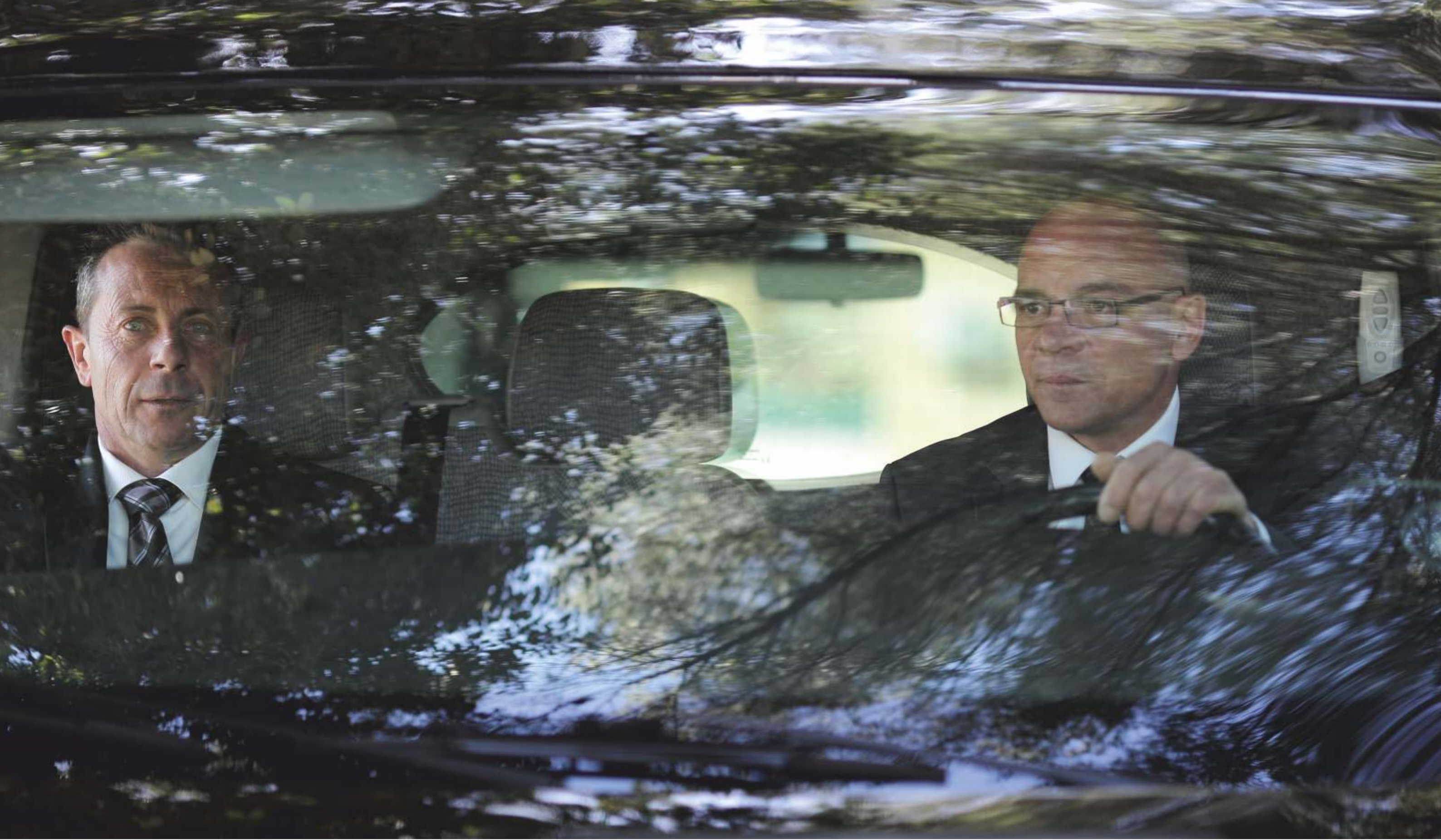
Lors du convoi funéraire, le maître de cérémonie accompagne la famille, dirige le convoi lors de ses différentes étapes : funérarium, lieu de culte, cimetière ou crématorium. Les obsèques sont assurées par le maître de cérémonie, un chef de convoi, un chauffeur et trois agents funéraires.