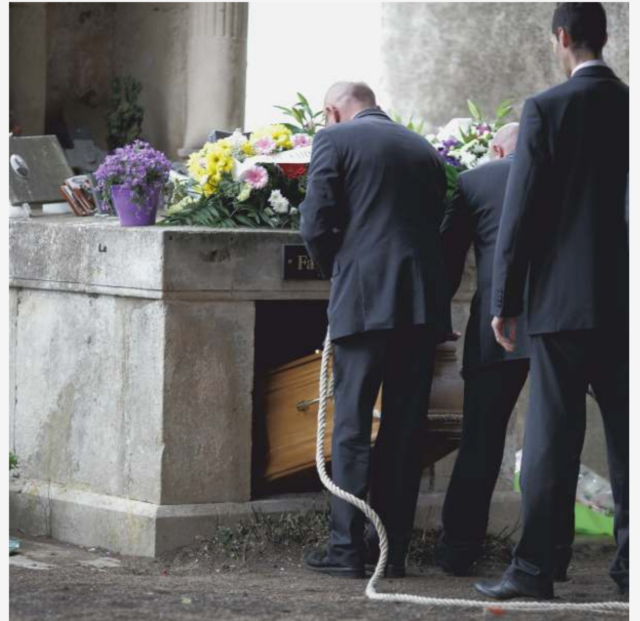
Dans le cimetière, à tour de rôle, les quatre agents funéraires se mettent en tenue de travail. C'est un rituel avec des gestes bien rodés où le solennel prime.