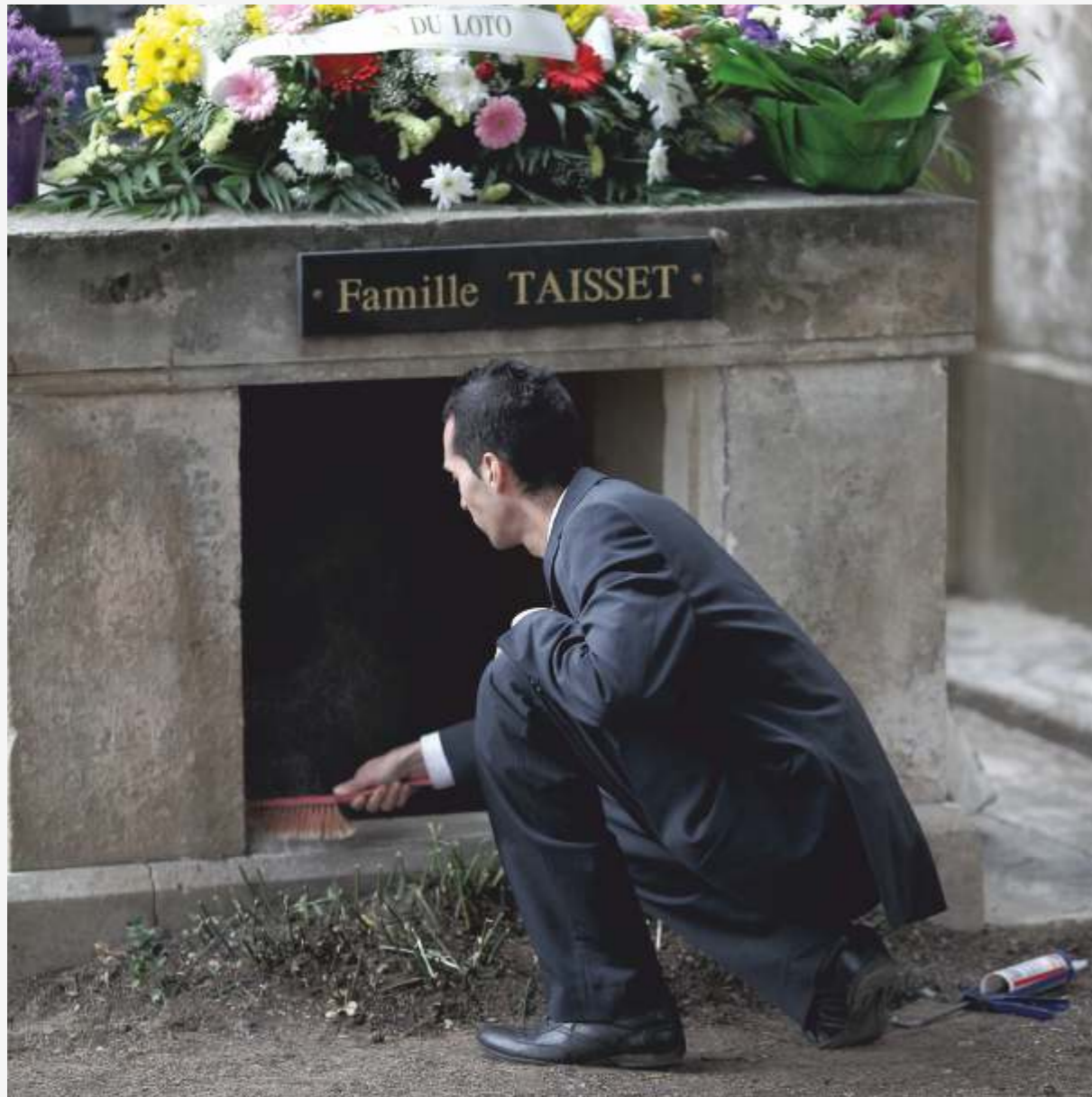
Chaque détail compte, chaque geste suit un rituel précis. L'agent funéraire, dépoussière l'entrée du caveau après son ouverture.